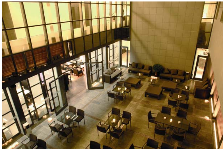
Interior de Hotel MOLINA LARIO de Málaga

El grupo se ha posicionado en la gama alta del público de negocios y ha conseguido mantener un 60% de cliente de repetición.